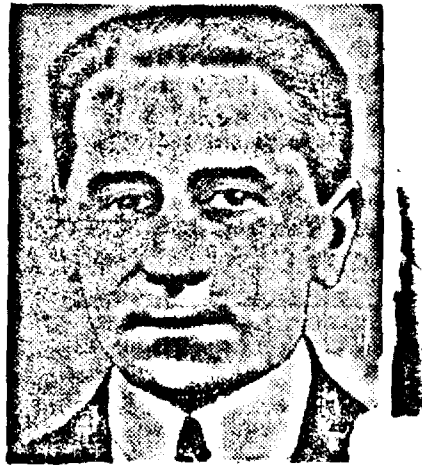
D. Gh. Tătărescu.

mandat îi expiră. Adică, la 15 Noembrie 1937, sau la 15 Ianuarie 1938, când se implinesc patru ani de când d. Gh. Tătărescu a fost încredințat cu guvernarea. Evident, în