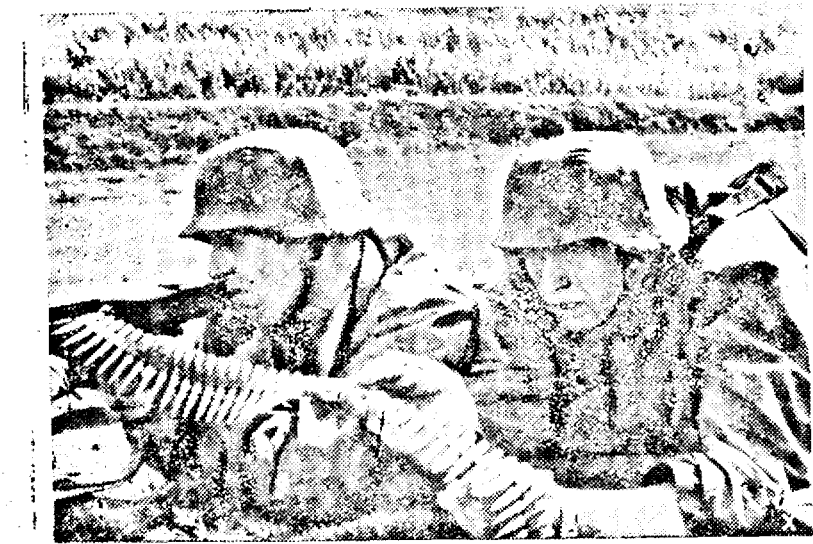
Mitraliști germani deschid focul împotriva sovietelor. (Pk. Ob.)

vietice au mari repercursiuni. Trupele germane și aliate au mari succese, s'au numărat 200 prizonieri, cifra este în creștere.