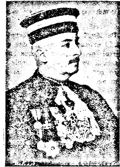
D. AL. C. VIFOREANU, procuror general al Inaltei Curți de Casație

Analizând cauzele acestei stări de lucruri, d-l Victor Iamandi constată că neajutorarea celor mai multe procese se datorește amânărilor solicitate de părți, fie pentru a temporiza judecarea, fie prin neprezentarea martorilor sau noilor probatorii cerute de părți. Pentru a înlătura consecințele dăunătoare ale acestor amânări, asupra celor care caută să-și valorifice dreptu-