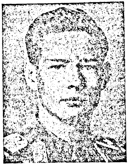
M. S. REGELE MIHAI I.

eroului și al eroismului său. Fier înseamnă omul gigantic, care se creiază ca un Prometeu în luptă cu materia și moartea. Fier înseamnă divinitatea din om, exprimată în înfrângerea, în zdrobirea lui Satana.