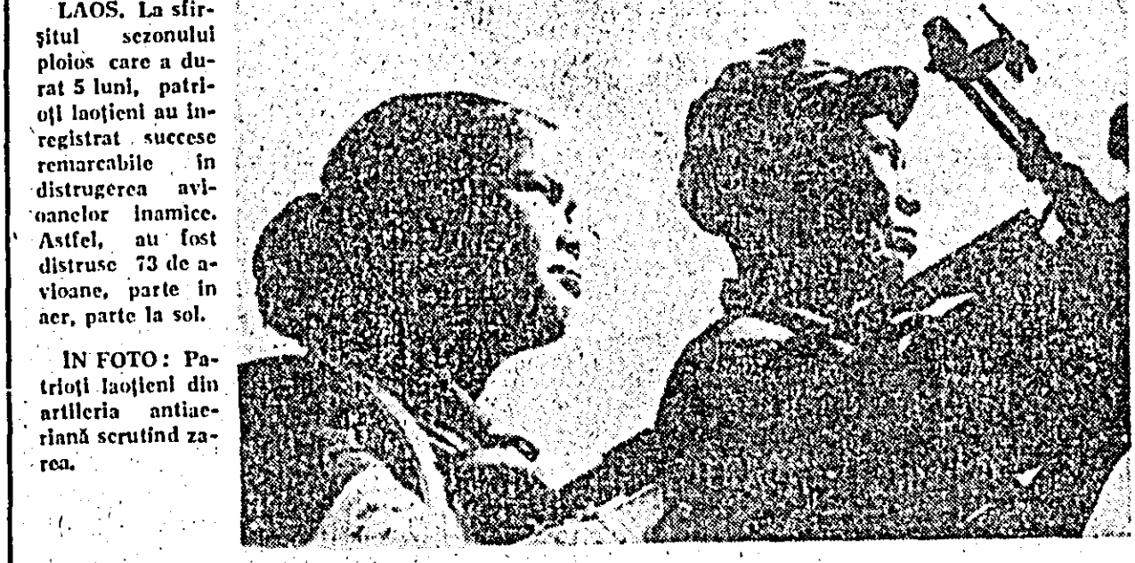
IN FOTO: Patrioții laotien din artileria anticraiană scrutînd zărea.

In orașul Valladolid din Castilia au avut loc ciocniri violente între studenți și poliție. Mii de studenți de la universitatea din localitate au protestat împotriva prezenței în incinta universității a forțelor polițienești. Opt manifestanți au fost arestați.