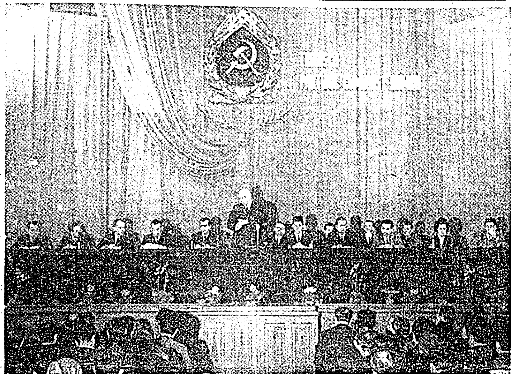
Prezidiul Confătăuirii de lucru.

Teri, în sala Palatului cultural, s-au desfășurat lucrările Confătăuirii de lucru a cadrelor de bază din agricultură și a activului de partid din județul nostru. Confătăuirea, organizată de Comitetul județean Arad al PCR, pe baza indicațiilor conducerii superioare de partid, a debătut felul cum se traduce în viață măsurile de decurg din Expunerea tovarășului Nicolae Ceaușescu la ședința de lucru de la C.C. al P.C.R. din 23 noiembrie 1970, cu privire la im-