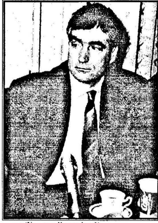
(Urmare din pagina 1)

Pe de altă parte, în 1991, toată recolta de grâu a fost preluată în măsura în care țărăni au dorit să o predea.