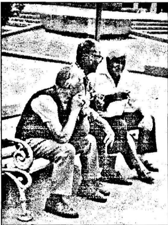
Depănând amintiri pe o bancă, în parc, sau nostalgia verilor de altădată...

Fără a avea pretenția de-a epuiza prezentarea vieții lor, ne-am propus totuși să scriem astăzi despre bătrâni, mai precis despre condiția pensionarului arădean în această dificilă și din păcate mult prea lungă perioadă de tranziție.