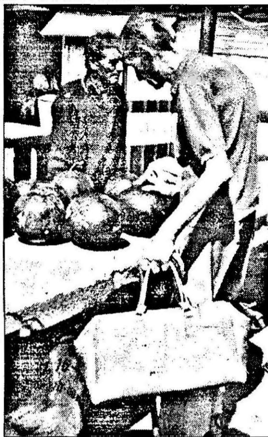
Chiar și sub povara anilor, unii pensionari mai găsesc puterea să facă zilnic piața.