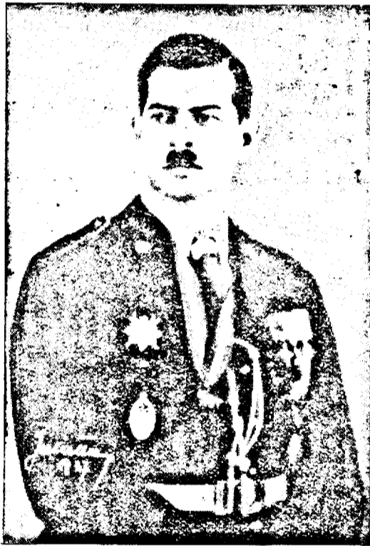
M. S. Regele Carol al II-lea

Noua Constituție menită să așeze temelii mai solide și mai drepte Statului nostru și să îndrumeze viața obștească pe o cale mai si- gură, mi liberă și mai sănătoasă.