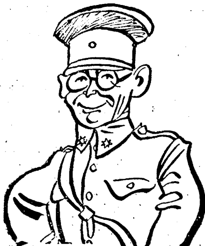
MOLA tábornok, a felkelők egyik vezére

Egyes lapjelentések szerint a valenciai kormány kebelében állítólag súlyos válság tört ki. Hír szerint CABALLERO miniszterelnök el távozik a népfrent kormányának éléről és NEGRI szocialista miniszter veszi át a miniszterelnökséget. Ebben az esetben úgy az anarchistákat, mint a kommunistákat kirekeszti a kormányból.