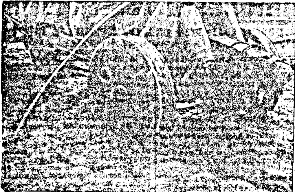
Artileria grea română, înainteză pe drumurile nerobozate ale Sovietelor

THAILANDA A DECRETAT STARE DE RAZBOIU Shanghai, 12. (Rador). Corespondentul Agenției DNB retransmite o știre din Bangkok din care rezultă că guvernul Thailandei a decretat starea de războiu în toată țara.