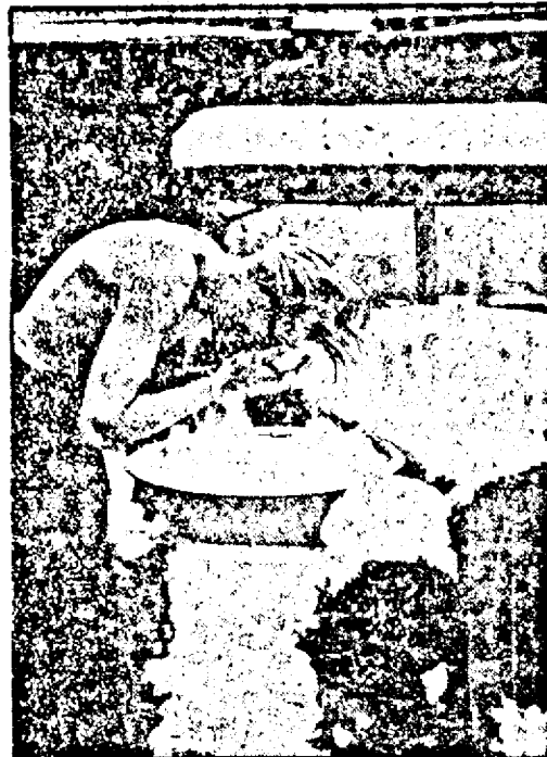
Dacă nu are apă, îi bună și zăpada

După înmânarea decorațiilor s'a ser- ...vit un ceai care a decurs într'o atmos- ...feră cordială și prietenească.