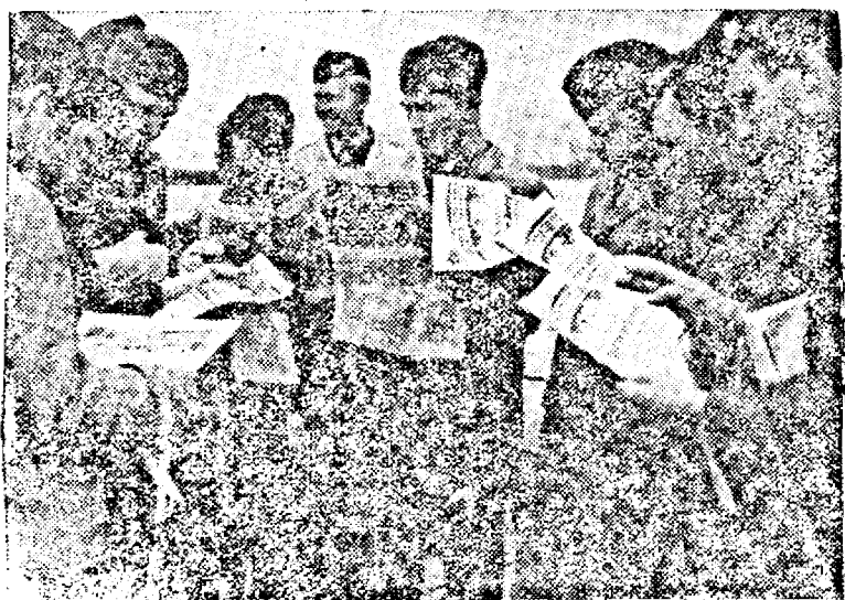
Echipajul unui submarin german după câteva săptămâni navește asupra ziarului de front.

În cursul lunii Februarie vor începe livrările de mașini agricole germane în România. În cadrul planului de 10 ani România va importa din Germania mașini agricole în valoare de 30 miliarde lei. Primul transport compus din 1.000 tractoare va sosi în curând în România. 300 tractoare vor fi puse la dispoziția Camerelor de Agricultură, iar 700 vor fi distribuite de Institutul Național al Cooperăției. Tractoarele sunt fabricate de uzinele Lanz, Hanomag și Deutz.