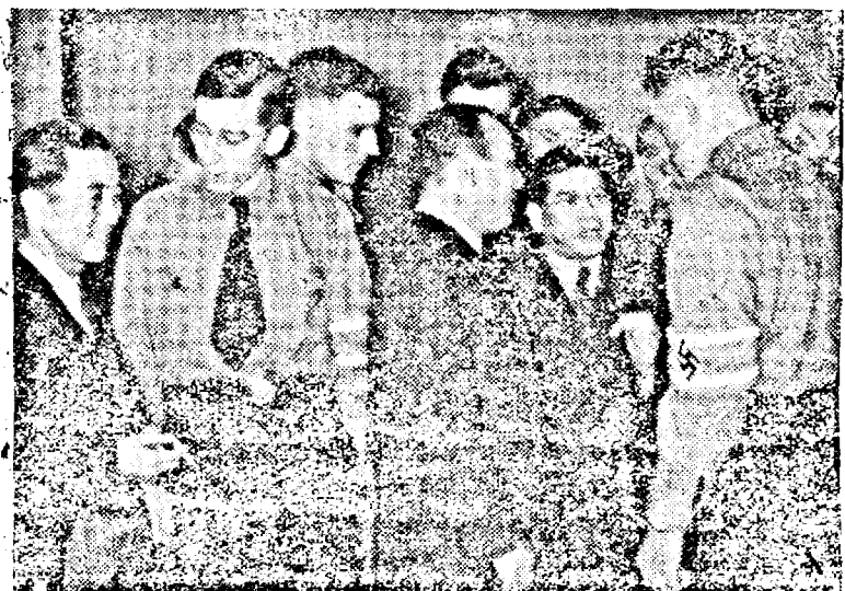
Studentii germani și japonezi stând de vorbă cu ocazia inaugurării concursurilor universitare germano-japoneze din Berlin

nul „WN 16” este o reușită construcție a ing. austriac Erich Meindl. Aparatul dispune de un motor Stern, cântărește 550 kg., măsoară 7.50 m. în lungime și 10 m. în lățime. Se ridică până la 3600 m. și poate duce cu sine benzină pentru trei ore de zbor. Motorul este așezat la spate, iar avionul are trei roate. După terminarea războiului, se va începe construcția în serie a acestui avion popular.