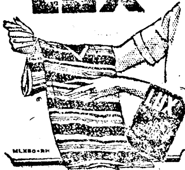
LUX SOAP CO. LONDON, PORT SUNLIGHT, ENGLAND