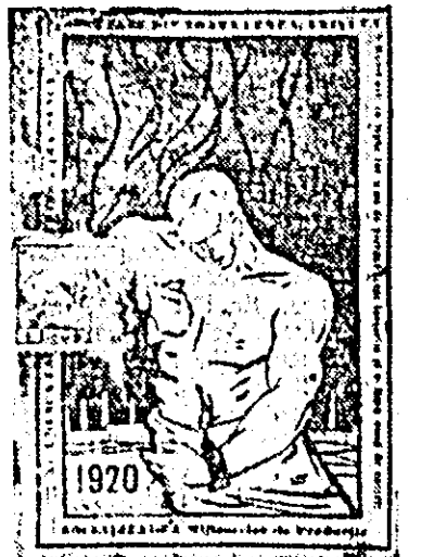
Copertă de carnet de membru al Comitetului General al Sindicatelor din România — 1920.