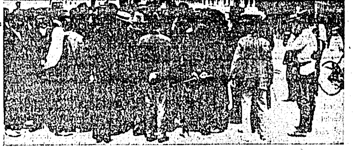
Mitingul politic ținut cu prilejul înmormîntării lui I. C. Frimu, de către muncitorii din București sub lozincă „Jos asasinii lui Frimu” — februarie 1919.