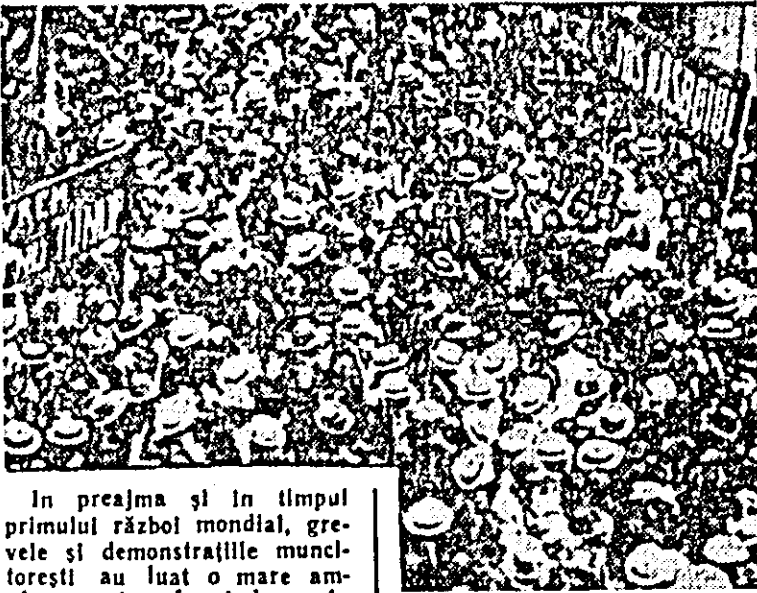
În preajma și în timpul primului război mondial, grevele și demonstrațiile muncitorești au luat o mare amploare, transformîndu-se în mari acțiuni de clasă.