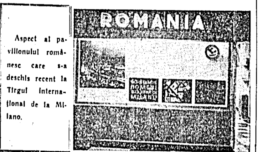
Aspect al pavilionului românesc care s-a deschis recent la Tîrgul Internațional de la Milano.

Luptele din Vietnam SAIGON 5 (Agerpres). — Cu toate planurile întreprinse de regimul militar de la Saigon în vederea mobilizării unor forțe etnical mari împotriva patrioților, Frontul național de eliberare și populația civilă reușesc să dea înamicului loviturile grele. În acest sens, agenția de presă Eliberarea menționa că înamicul a mobilizat în ultima săptămîină a lunii aprilie șase batalioane, trei escadroane de blindate, 60 ambarcațiuni și nave de război sprijinite de un mare număr de avioane în cadrul unei operațiuni desfășurate în regiunile Ranch Gia și Can Tho. Armata și populația satelor însă, arăta agenția citată mai sus, arăta agenția citată mai sus, au răstosat puternic. De-a lungul a trei zile de lupte, patrioții sud-vietnamezi au ucis 180 soldați înamici și au rănit 80. Ei au reușit, de asemenea, să scufunde patru ambarcațiuni și să avarieze alte patru. De asemenea, au fost doborîte și avariate cinci avioane, iar un car blindat a fost distrus. În cursul aceluiași lupte, 100 de soldați din armata regimului de la Saigon au decertat.