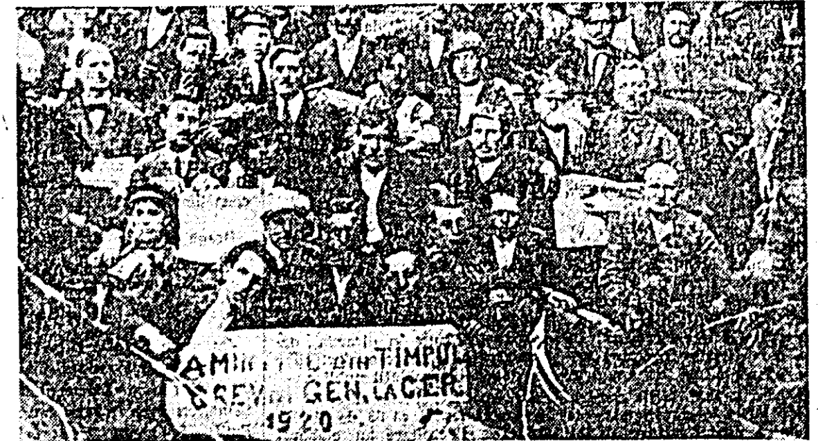
Mișcarea muncitorească a cunoscut între anii 1918—1920 o creștere impetuoasă, a avut loc un val de lupte muncitorești, care au culminat cu greva generală din 1920. Circa 400.000 de muncitori din industrie și transporturi, adică aproape întregul proletariat din România, au participat la grevă, paralizînd un timp întreaga viață economică a țării. În aceste condiții de frământări sociale, Ideile Marii Revoluții Socialiste din Octombrie au găsit un teren deosebit de fertil. Aripa revoluționară din mișcarea muncitorească a mobilizat masele muncitorești la lupta pentru crearea Partidului Comunist și alăturarea lui la Internaționala a III-a.