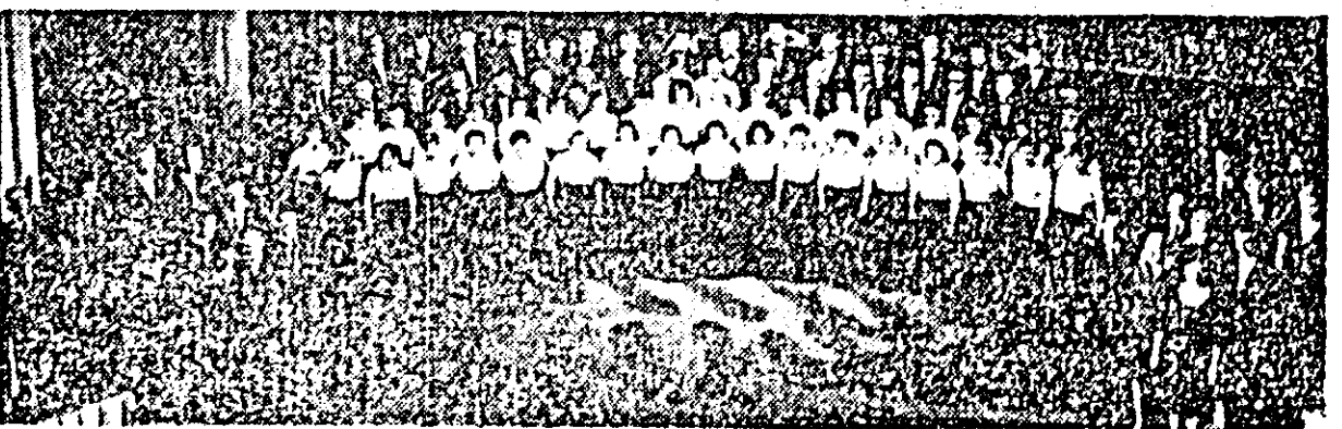
ÎN IMAGINE: un aspect din timpul montajului literar-artistic prezentat cu ocazia adunării consacrate aniversării partidului.