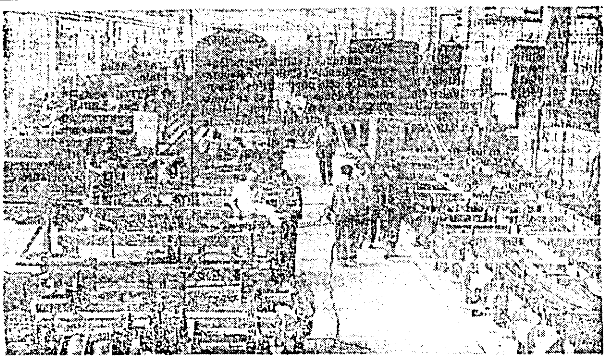
Întreprinderea de vagoane — secția prototipurii. Aici, în această secție, din care vă prezentăm un aspect general, se „nasc” noile tipuri de vagoane, rod al gîndirii inginerilor și măiestriei muncitorilor.