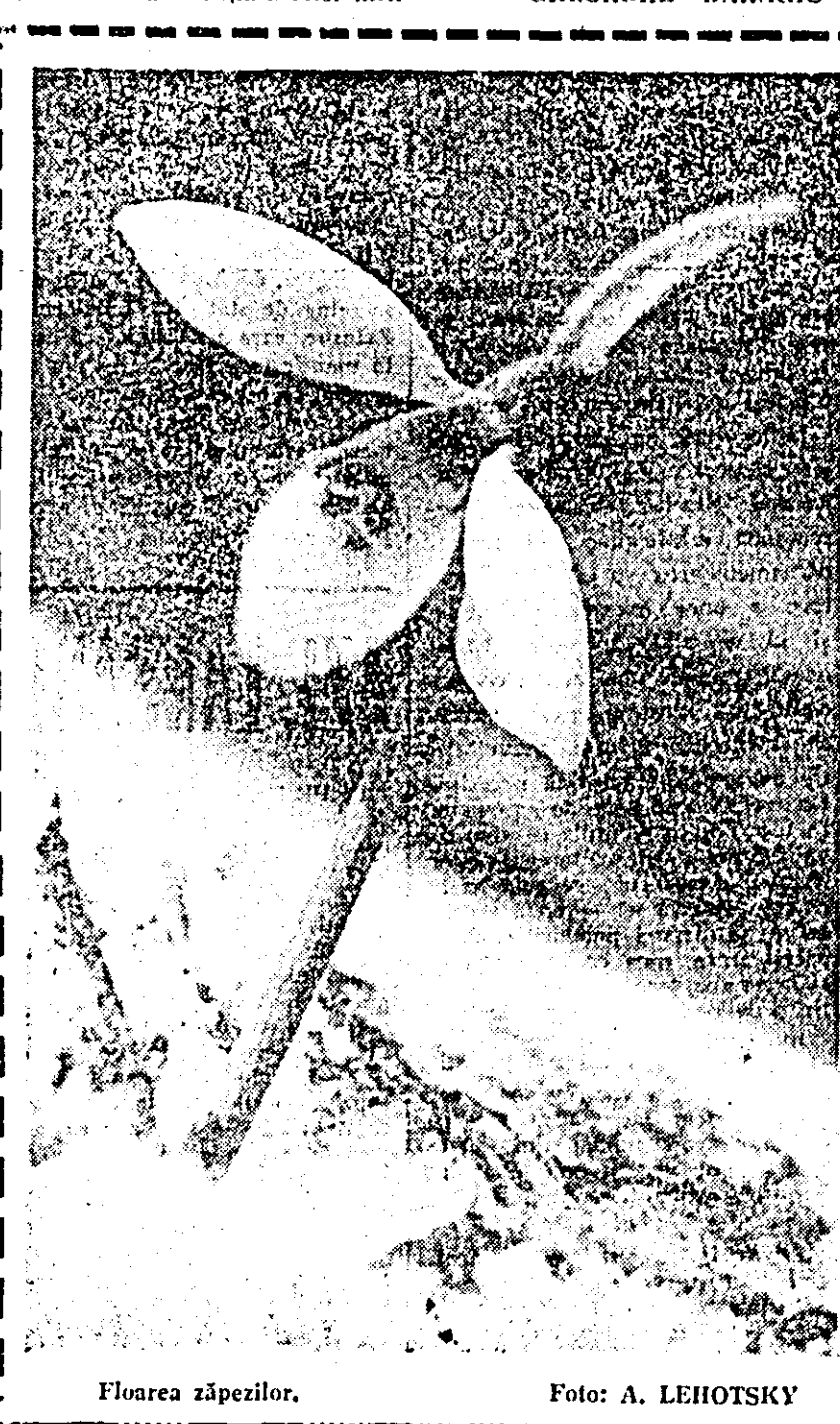
Floarea zăpezilor.

rajaelor poate fi urmărită ușor de conducere și specialiștii unităților respective. Nu toate cooperativele agricole însă manifestă preocupare pentru buna hrănire a animalelor. Consiliile de conducere, însăși specialiștii din unele unități, nu acordă atenția cuvenită gospodării furajelor și furajării animalelor. Spre exemplu, la cooperativa agricolă din Măderat, Tipari II, Zăbalt, Sebiș, Firticaz, Șeitin, Ineu II, Cermei și altele, finul nu este bine vîrfuit, nu este acoperit cu paie sau polietilenă, fiind lăsat să putrezească. Cantități însemnate se pierd în loc să fie îngrijite și drămuie pentru a ajunge pînă la primăvară. De fapt, în unitățile amintite nici față de alte furaje nu se manifestă vreun interes deosebit, lucru ce duce din păcate la nerealizarea producțiilor animale, stabilite dacă nu se vor lua măsuri eficiente pentru eliminarea neajunsurilor. La Șeitin de exemplu, tuteii se administrează descori netocaci, nepreparați. Pus în fața situației de fapt, consiliul de conducere a unității aduce scuze puerile. „E oare un motiv de a nu toca tuteii... „fiindcă nu sint cuțitele tocătorii ascuțiți”? Oare cine ar trebui să se intereseze de aceste lucruri, nu tocmai cei de la Șeitin?” De fapt și la Sînlăeni, Vladimirescu, Mîndruloș și Semlac tuteii