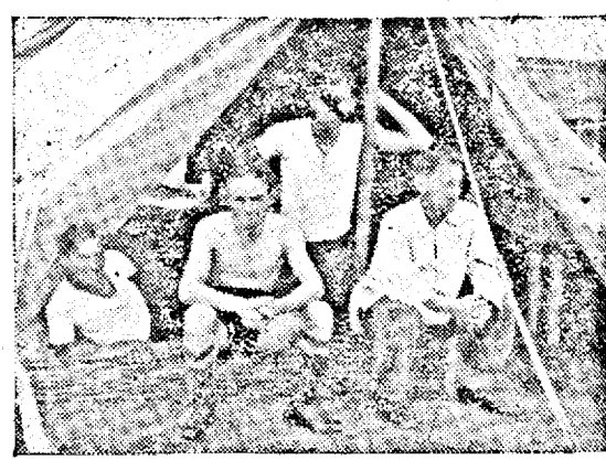
La ușa cortului...