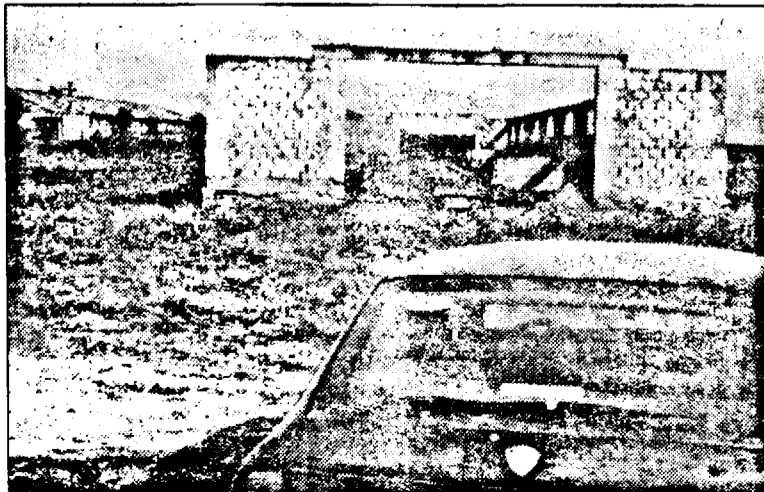
Viitorul fabrică „Calper”

Grupaj realizat de TEODORA MATICA SORINA AMBRUS