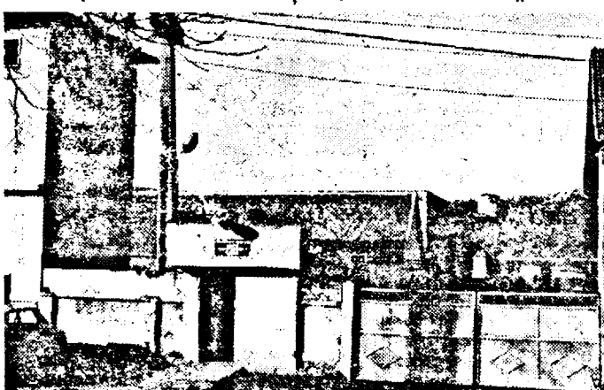
În spațiul fostei secții Astra au apărut noi firme