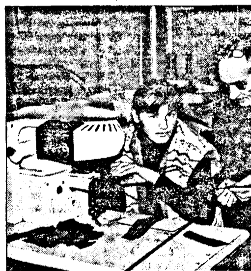
Cea mai tânără angajată a firmei Boselli

DI. Uivari ține cont de zona de frontieră, tranzitată de persoane cu diverse convingeri religioase. Așa că dorește cu orice preț ca alături de motel să construiască un complex ecumenic, format din