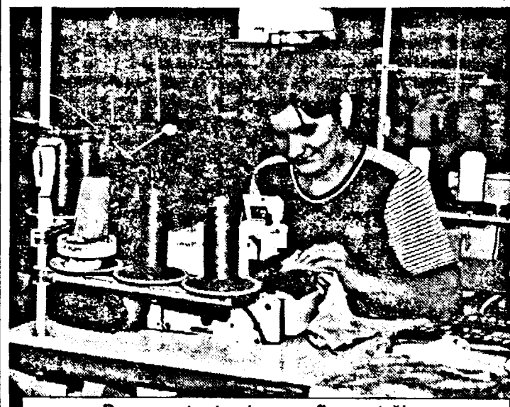
Reprezentante ale unor firme străine importante își desfășoară activitatea la Lipova.