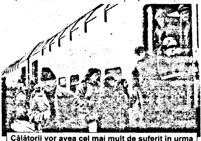
Călătorii vor avea cel mai mult de suferit în urma unei eventuale greve a sindicaliștilor feroviari