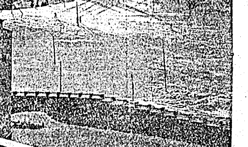
Cota 1400, după-amiază pe prile.

Potrivit datelor primite de la Ministerul Metalurgiei și Construcțiilor de Mașini, anul acesta turnarea de precizie în modele ușor fuzibile se va aplica la un volum de peste un milion de piese cu o valoare de aproape 80 la sută mai mare decît anul trecut.