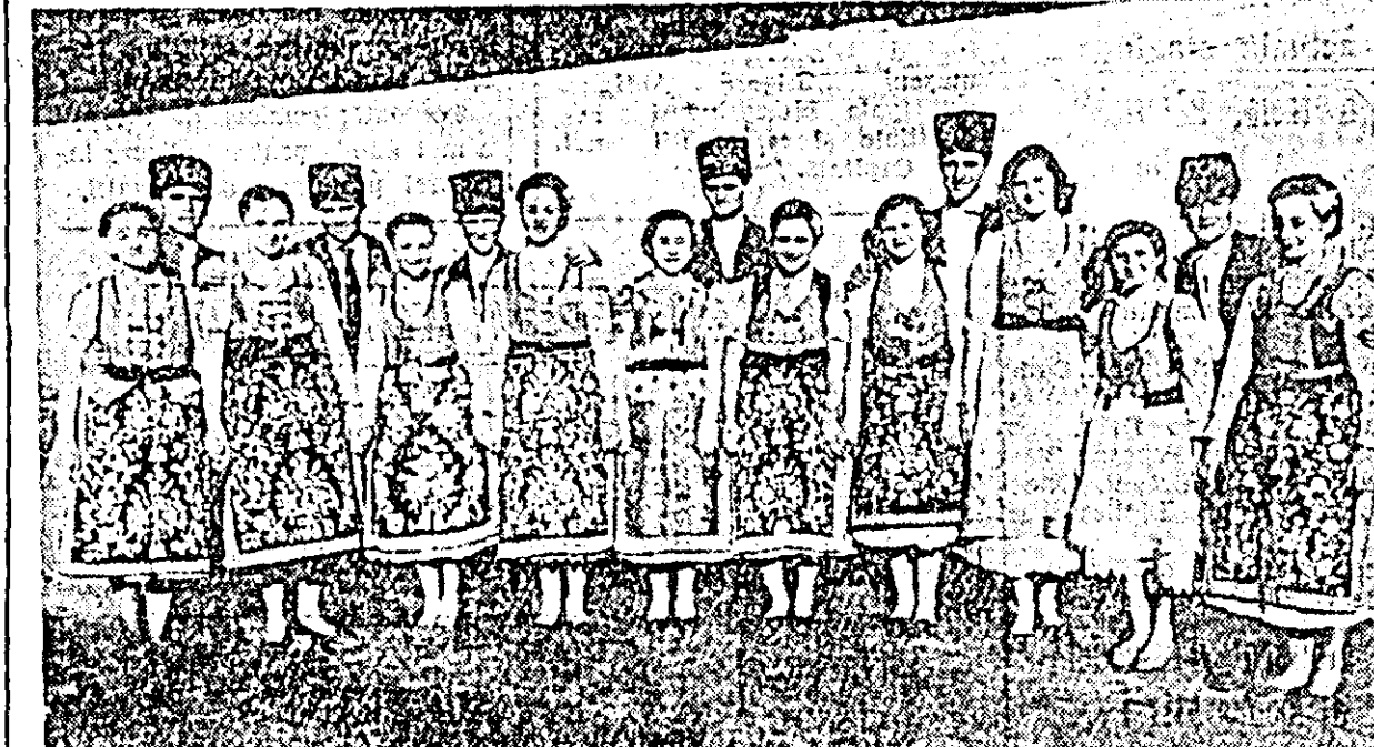
Membrii brigăzii artistice de agitație a căminului cultural din comuna Mindruloc fotografat după terminarea spectacolului.

Stau cu oțelarii așază la un loc sau sculptori de raze niciodată stîrne, și-mi adun în suflet marea lor foc ce-și revorșă-n mine întîmte-aprinse. V-am privit — printre scîntele țîștite — mințile bronzate-n sfîrcări violete; știu cum ele scriu în timp neobosite, cum se-nitec sub zori la creuzete. Anotimpu-acest cu braț de-oțel se-ndreaptă înspre zarea nouă, dînd contur la vise, înțînd voi sinteți ocel ce puneți treapă elicilor de mîne strălucit de deschise. AL. STEPANESCU, membru al cercului literar „Al. Sahia”