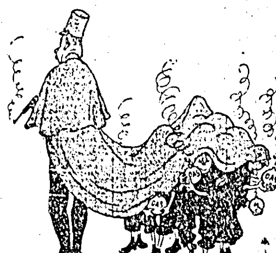
desen de M. ABRAMOV.

Sub oblăduirea poliției franceze, fasciștii din OAS își desfășoară activitatea criminală nestingherită, comițînd numeroase acte de teroare și atentate la viața elementelor progresiste din Franța și Algeria.