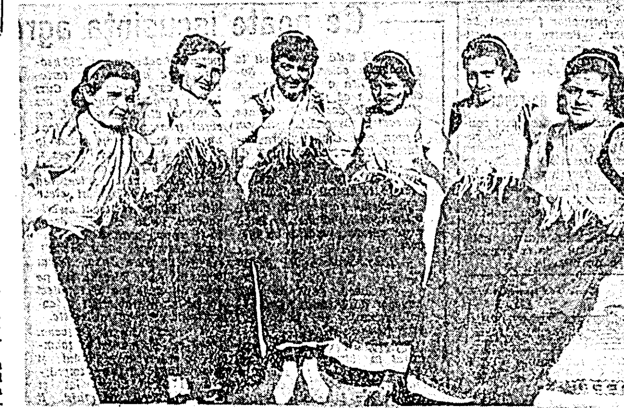
ÎN CLISEU: echipa de dansuri germane a căminului cultural din comuna Frumusești.