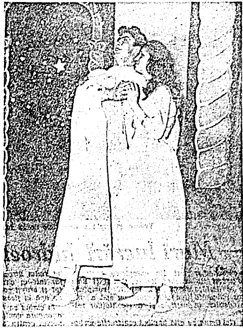
ÎN CLISEU: o scenă din timpul prezentării poemului drammatizat „Lucașărul” de M. Eminescu.