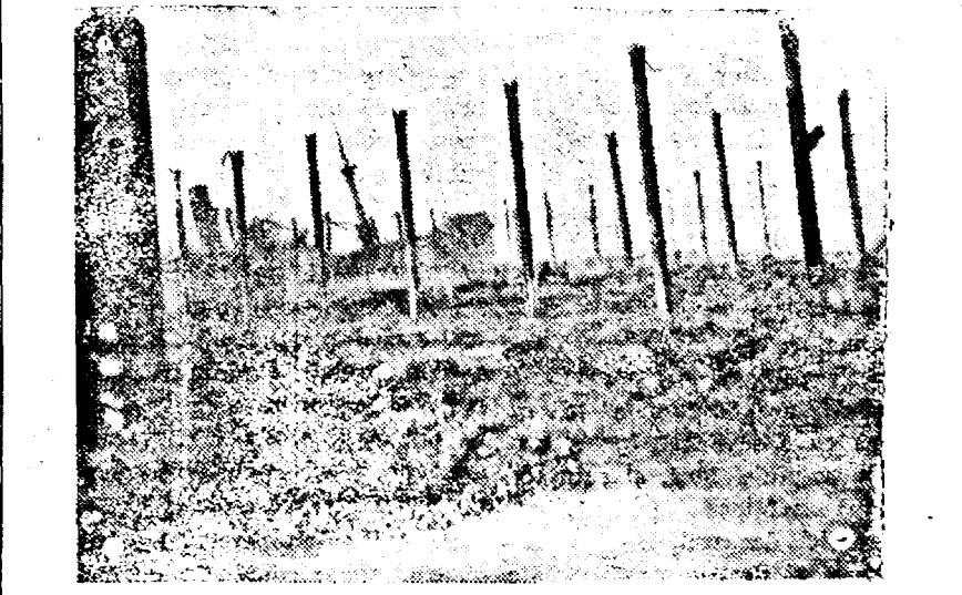
Aspectul unei uzine de armament britanic după un bombardament

Ca urmare la invitația ministerului instrucțiunii publice din Suedia, guvernul german a aprobat organizarea unei expoziții a cărții germane la Stockholm. Expoziția va cuprinde literatură, artă și știință. Un stand special se va amenaja pentru arta grafică. Concomitent cu expoziția dela Stockholm, mai mulți învățați vor ține conferințe în orașe suedeze despre literatura germană contemporană. (RDV)